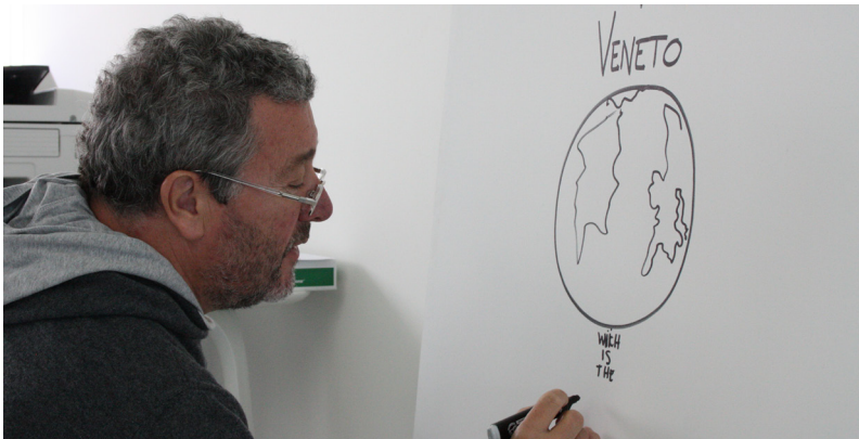
Designer bei Magis