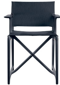
Frame: Black 1765 C Seat + Back: Black F-758