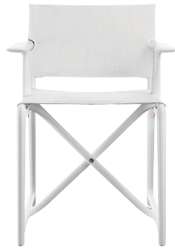
Frame: White 1735 C Seat + Back: White F-738