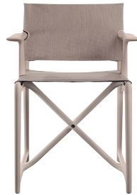
Frame: Beige 1733 C Seat + Back: Beige F-458