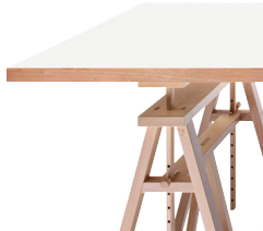
Frame: Natural Beech Top: White MDF 8500 / Black MDF 8510 (reversible)