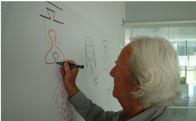
Designer chez Magis