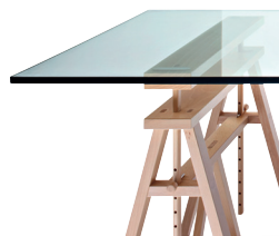
Frame: Natural Beech Top: Transparent glass