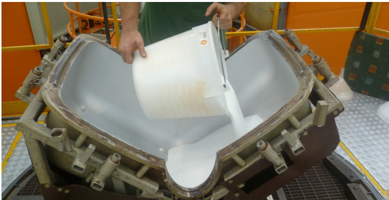
Processo di Produzione e designer in Magis

Lo sviluppo della poltrona Nimrod ha richiesto molti anni di ricerche prima di arrivare al prodotto definitivo, sul mercato dal 2009. Obiettivo iniziale di Magis era di realizzare questo prodotto con la tecnologia del blow-moulding, ma dopo innumerevoli tentativi senza raggiungere quel grado di qualità tecnica a cui Magis sempre ambisce, questa direzione è stata abbandonata per risolvere il prodotto con la tecnologia del rotational moulding, che ha portato ad una migliore definizione estetica dell'oggetto.