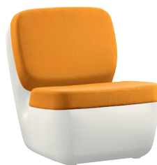
Shell: White 1736 C Cushions: Yellow F-576 (426)