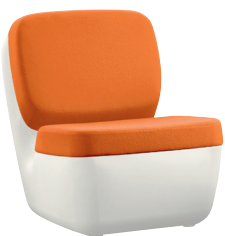
Shell: White 1736 C Cushions: Orange F-083 (542)