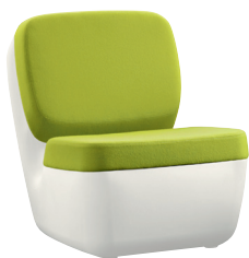
Shell: White 1736 C Cushions: Green F-346 (936)