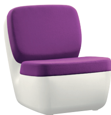
Shell: White 1736 C Cushions: Purple F-488 (666)